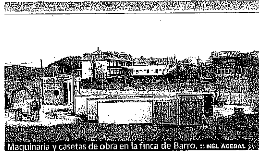
Maquinaria y casetas de obra en la finca de Barro.

Además, el primer edil recordó que el gobierno local sigue apostando por el proyecto presentado al Principado para la construcción de un albergue de peregrinos en el edificio que ocupaba la anterior oficina de turismo de Colombres. «Si desde la Consejería no se nos da respuesta, el Ayuntamiento ejecutará esa obra por sus propios medios en cuanto le sea posible», anunció Bordás.