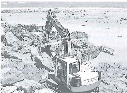
La pala en el Arenal de Morís.

La empresa Tragsa empezó ayer a arreglar la escollera y a reconstruir una barandilla del Arenal de Morís, en el concejo de Caravia, donde la Demarcación de Costas invertirá unos 18.000 euros en arreglar los destrozos de los últimos temporales. Continuarán en el municipio por las playas de La Espasa -donde las obras costarán 90.000 euros y por el Visu (12.000), informa P. M.