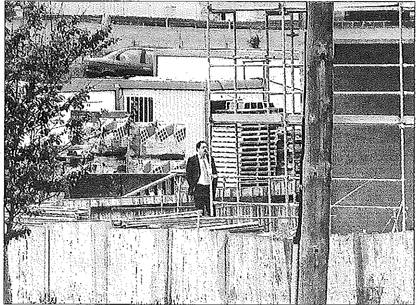
El secretario municipal de Llanes, durante una visita que giró a la obra del hotel Kaype en la tarde del jueves 3.

Asimismo, los servicios técnicos y jurídicos llaniscos mantienen, contra el criterio de Urbanismo, que fue correcto otorgar cuatro alturas (tres, más ático). Ello pese a que en aquellos concejos careantes de planeamiento urbanístico general (Llanes ha visto anulados por los tribunales de justicia todos los planes