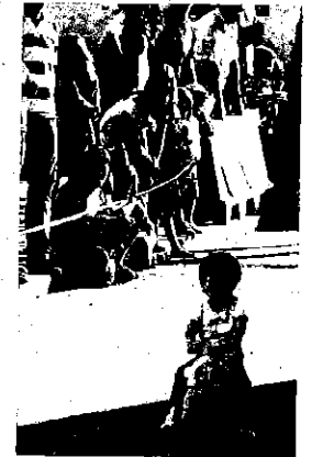
Una participante infantil.

Por tiempos venció 'Chirura Sport' y en la categoría de mejor diseño ganaba 'La Atalaya bala azul'