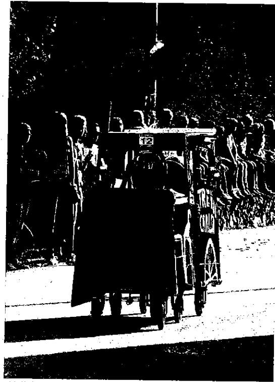
El bólido conocido como 'El Tren del Chalco'.

:: GUILLERMO FERNÁNDEZ COLOMBRES. La carrera de los Autos Locos ya no es una novedad en Ribadadeva, pero ha pasado a convertirse en una actividad de presencia multitudinaria y una prueba a medio camino entre la competición y la diversión. La carrera alcanzaba ayer su cuarta edición y está patro-