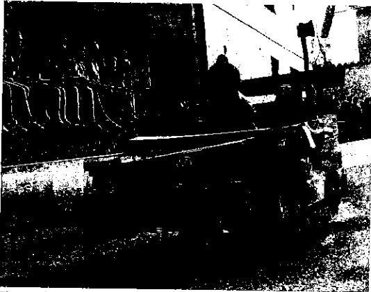
El paso del vehículo bautizado como 'Troncos Wagen'.