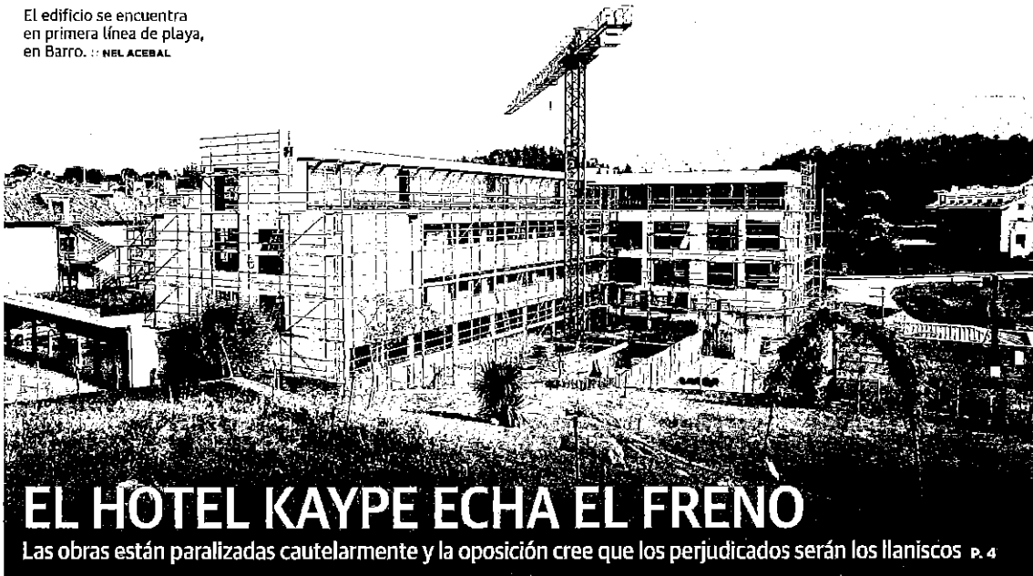
El edificio se encuentra en primera línea de playa, en Barro. ■ NEL ACEBAL

Asturias sigue en el vagón de cola del crecimiento con 96.218 parados mientras los datos de afiliación a la Seguridad Social tampoco son positivos. En España aumentan en 12.182 personas y en el Principado caen en 5.267. p. 14