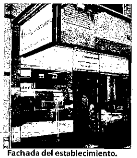
Fachada del establecimiento.

ASICO Equipamiento Laboral, quiere facilitar el acceso a sus productos a través de su web www.asicoel.com donde podrá realizar sus compras vía online.