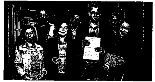
Los miembros de la candidatura de Upil, en el notario.

como consecuencia de los procesos judiciales abiertos. En primera instancia los jueces habían considerado que el permiso no se ajustaba a derecho porque la edificabilidad concedida era superior a la permitida pero, con la última sentencia, el Alto Tribunal Asturiano anula totalmente la licencia de obras.