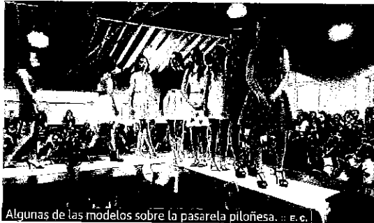
Algunas de las modelos sobre la pasarela piloñesa. :: E. C.

:: E. C. La sala polivalente de la plaza Josefa Canellada de Infiesto quedó abarrotada este viernes con un desfile de moda. Se celebraba para recaudar fondos para el viaje de estudios de los alumnos del Instituto. Niños y jóvenes actuaron como modelos con los conjuntos presentados por los establecimientos del concejo.